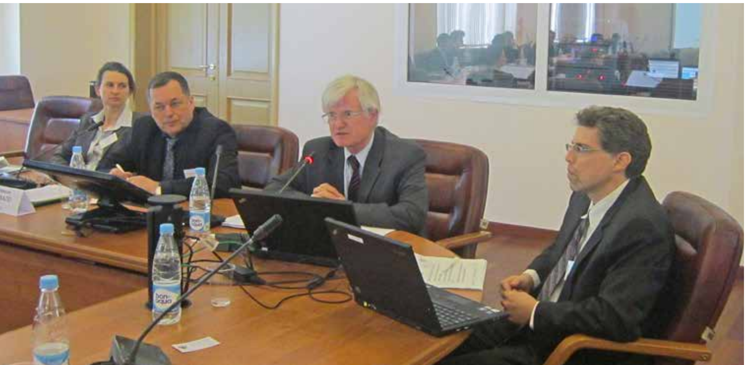
Семинар ОБСЕ-МОМ по совершенствованию сбора миграционных данных, Москва, март 2013 г.

комитета СНГ и российских академических кругов, а также международных экспертов, обсудили международные стандарты, региональные и национальные аспекты сбора данных о миграции, пути дальнейшего совершенствования ведения статистического учета миграции в Российской Федерации, а также шаги, необходимые для гармонизации и обмена данными о миграции между Россией, Казахстаном, Кыргызстаном и Таджикистаном. Данный семинар был частью реализации совместного проекта ОБСЕ и МОМ, направленного на поддержку гармонизации процессов сбора миграционных данных в странах региона Евразийского экономического сообщества (ЕврАзЭС). Результаты четырех проведенных страновых оценок, шаблон для сбора данных, а также выводы и рекомендации, сделанные в ходе осуществления проекта, будут собраны вместе в справочнике, который планируется подготовить к концу года. Главным итогом семинара стало принятие общих шаблонов для сбора согласованных данных о миграции (статистических индикаторов), которые могут помочь сбору данных и обмену ими в регионе ЕврАзЭС.