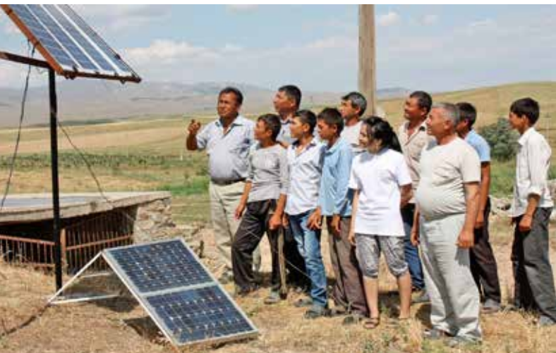
Офис Координатора проектов ОБСЕ помогает в обучении и проведении мероприятий в отдаленных районах по применению небольших установок на основе возобновляемых источников энергии, Джизакская область, Узбекистан, июнь 2012 г.

стана, его научных кругов, из более чем 15 различных министерств, государственных агентств и компаний. Международные эксперты представили обзор нефтяной и газовой промышленности в других странах-экспортерах газа, а также методы и процедуры оценки нефтегазовых комплексов и соответствующие методы ведения переговоров. Помимо этого, участники семинара обсудили практические примеры, связанные с заключением международных нефтегазовых контрактов. Семинар способствовал углублению знаний его участников по вопросам энергетической дипломатии и повышению их потенциала в области разработки энергетической политики. В ответ на проявленный большой интерес к данной теме и высокий уровень участия в семинаре, имеется в виду проводить такие мероприятия и в будущем.