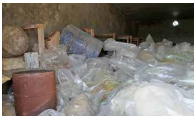
Устаревшие пестициды, хранящиеся в Приднестровском регионе Молдовы