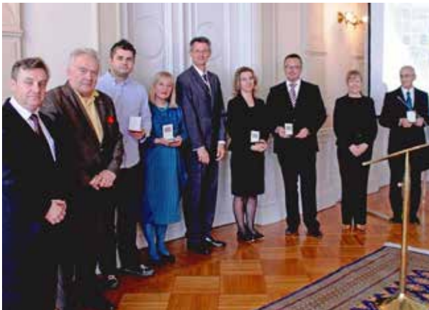
Победители конкурса ОБСЕ на лучший экологический репортаж, Сараево, июнь 2013 г.