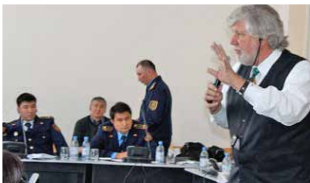
Выступление эксперта на национальном семинаре по пересмотренным стандартам ФАТФ, Астана, апрель 2013 г.

В течение отчетного периода Центр ОБСЕ в Астане организовал и поддержал проведение семи местных и двух региональных семинаров и учебных курсов по этим темам. В декабре 2012 г., в партнерстве с Финансовой полицией Казахстана и Бюро по международной наркоторговле и правоохранительной деятельности Посольства США в Казахстане был проведен семинар, посвященный международным механизмам и инструментам борьбы с «отмыванием денег» и финансированием терроризма. На него собрались 70 правительственных чиновников, представляющих правоохранительные органы, судебную власть, учреждения банковского и финансового секторов. Подчеркивалось значение современных инструментов и эффективных практик в области ПОД/ФТ, а также финансовых методов расследования в банковском секторе на основе опыта Украины, Великобритании и США. В апреле 2013 г. в Астане Центр ОБСЕ в Астане и БКЭЭД , в сотрудниче-