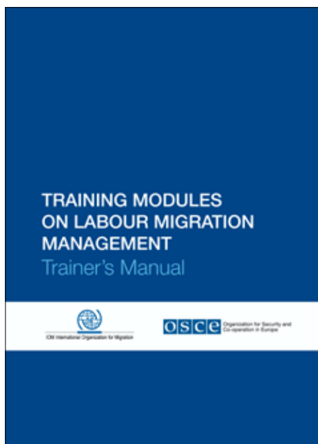
Лицевая сторона «Учебных модулей по управлению трудовой миграцией – пособие для преподавателя», изданного ОБСЕ и МОМ.

В марте 2013 г. в Москве БКЭЭД провело семинар на тему «Совершенствование сбора и использования сопоставимых данных о миграции, а также обмена ими в Казахстане, Кыргызстане, Таджикистане и России». Семинар был организован совместно с МОМ и Московской Высшей школой экономики. Его 40 участников, включая государственных служащих из Российской Федерации и трех стран Центральной Азии, представителей Межгосударственного статистического