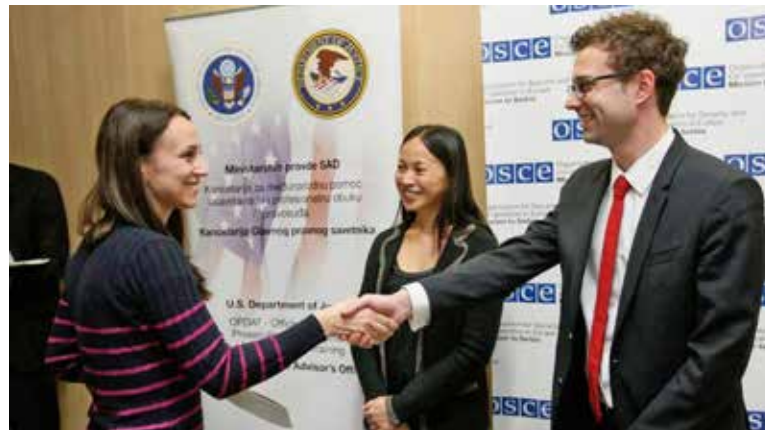
Организаторы из ОБСЕ поздравляют слушателей с окончанием курсов обучения судебно-бухгалтерской экспертизе, Сербия

лицейской деятельности ОБСЕ организовали Семинар по идентификации, аресту и конфискации преступных активов, полученных от торговли людьми. Его участниками стали 35 албанских полицейских, прокуроров, судей и членов Генеральной дирекции по предотвращению легализации незаконных доходов. Среди докладчиков были также международные эксперты из Лихтенштейна, Швейцарии и Великобритании. Цель семинара заключалась в повышении осведомленности о том, как эффективно противодействовать преступной финансовой деятельности, связанной с торговлей людьми, на национальном уровне путем наращивания потенциала и сотрудничества между полицией и другими соответствующими правоохранительными органами.