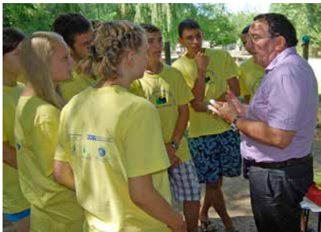
Сотрудник Миссии ОБСЕ беседует с участниками летней школы в селе Сахарна, Республика Молдова, июль 2012 г.

бопровода. Центр ОБСЕ обсудил возможности решения проблемы использования питьевой воды жителями Кыргызстана и Таджикистана с Германским обществом по международному сотрудничеству (GIZ) и Всемирной продовольственной программой ООН, работающими в этой сфере, и скоординировал общие усилия с целью проложить дополнительный водопровод, что могло бы облегчить доступ к воде для обеих сторон. Строительство указанного водопровода будет завершено к концу 2013 г.