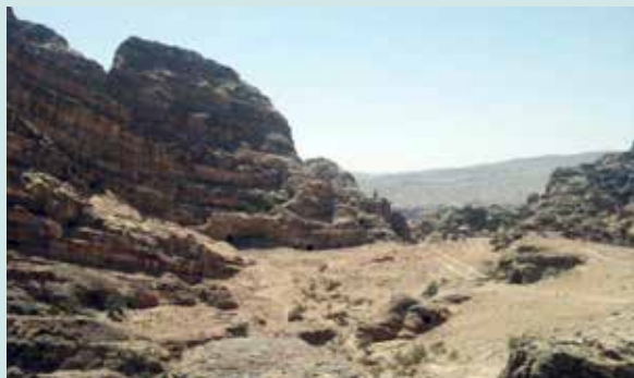
Засушливый пейзаж юга Иордании; около 75% территории страны имеет пустынный климат с менее чем 200 мм осадков в год.

Проектное предложение включает два различных этапа. Первый этап объединяет проведение двух экспертных семинаров, направленных на подготовку проекта доклада, который послужит основой для обсуждения в ходе второго этапа. Второй этап будет состоять из региональных консультаций, посвященных разработке рекомендаций и программы работы.