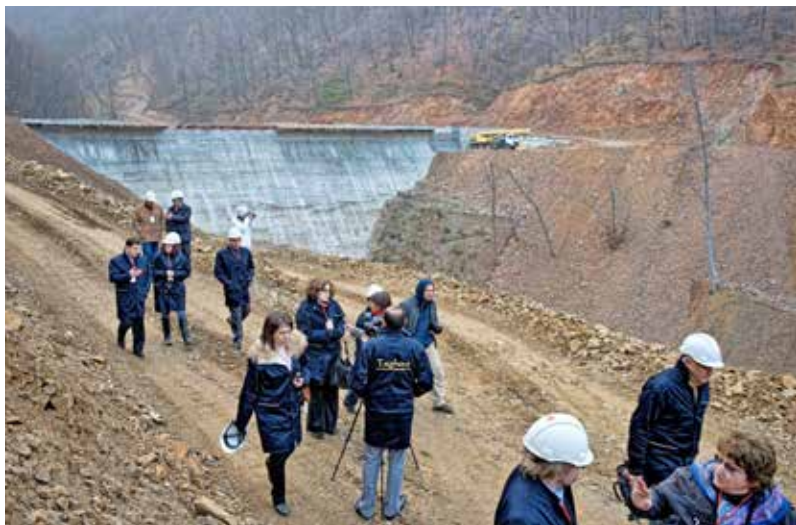
Посещение места добычи меди в г. Алаверди, Армения