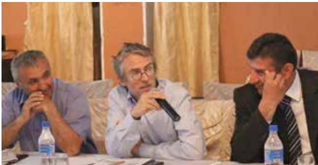
Представители заинтересованных сторон активно участвуют в общественных слушаниях по разработке Экологического кодекса Таджикистана, г. Хорог, май 2013 г.

источников энергии, энергоэффективности, «зеленого роста» и инновационных технологий; а также на содействие переходу к «зеленой экономике» в регионах страны. Казахстан намерен завершить разработку данной стратегии к концу 2013 г. и сразу же приступить к ее реализации, приняв на себя обязательство ежегодно расходовать на ее цели 1% ВВП. В партнерстве с отделением ПРООН и делегацией ЕС, Центр ОБСЕ твердо поддерживал инициативы Казахстана, касающиеся «зеленой экономики» и «зеленого моста», в течение последних 3-х лет.