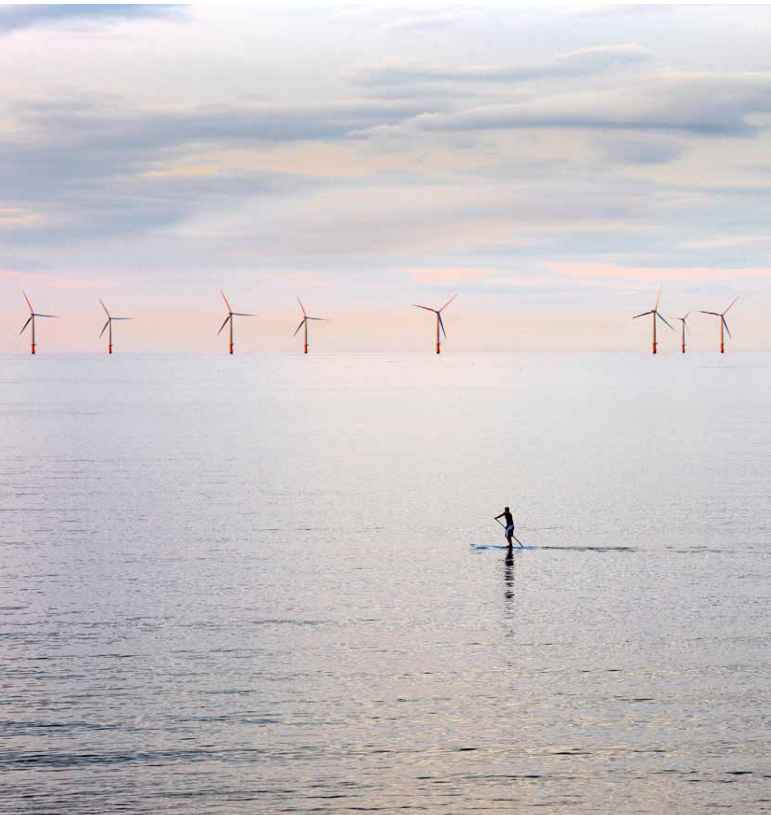
Серфер, гребущий веслом у ветропарка вблизи бухты Колвин, Северный Уэльс, Великобритания.

Это фотография вышла в финал фотоконкурса «Охраняя наше будущее: устойчивое развитие транспорта и энергетики», организованного БКЭЭД по случаю Экономико-экологического форума ОБСЕ 2011 г. В рамках Форума 2013 г. продолжится диалог по энергетике и экологии.