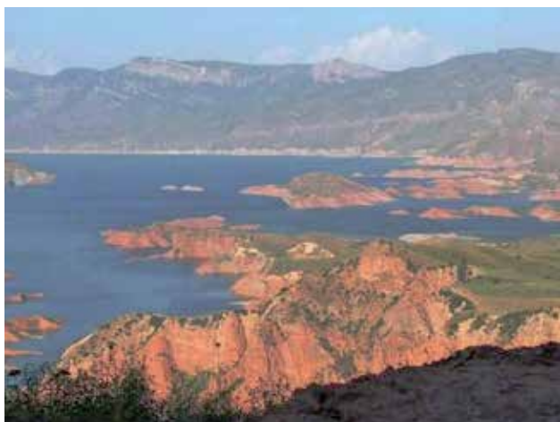
Нурекское водохранилище в Таджикистане; этот резервуар поставляет воду для ГЭС, обеспечивает питьевой водой г. Нурек, а также питает ирригационные системы на сельскохозяйственных землях.

Вопросы современного управления водными ресурсами оставались на видном месте в повестке дня Центра ОБСЕ в Астане . Его деятельность в этой области касалась поверхностных и подземных вод, запасов питьевой воды, а также проблематики таяния ледников. В течение отчетного периода были реализованы восемь проектов , направленных на наращивание потенциала в области управления водными ресурсами и деятельности, связанной с изменением климата. Большим событием стало открытие в октябре 2012 г. Учебного центра по управлению водными ресурсами в г. Кызылорде . Как ожидается, он будет способствовать более эффективному управлению водным бассейном Арал-Сырдарья. Центр был учрежден совместными усилиями Центра ОБСЕ в Астане, Кызылординской областной администрации, исполнительной дирекции Международного фонда спасения Арала (МФСА) в Казахстане и Кызылординского государственного университета. Он обеспечивает подготовку по интегрированному управлению водными ресурсами, экологическому законодательству, естественным наукам, водной инженерии и проблематике изменения климата. Центр ОБСЕ способствует проведению учебных программ там, где они соответствуют его мандату в области управления водными ресурсами в контексте расширения регионального сотрудничества по вопросам безопасности. Первые курсы получили положительные отзывы от национальных и местных органов власти. В частности, в