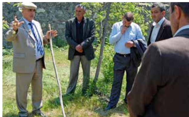
Местные жители, участвующие в мероприятии проекта CASE, посвященном росту осведомленности и обучению по вопросам борьбы с деградацией земель, Азербайджан

В рамках своей кампании «Зеленая миссия», Миссия ОБСЕ в Боснии и Герцеговине поддержала организацию Дня Земли на Экологической ярмарке 2013 г. , направленного на содействие деятельности гражданского общества, новаторов и бизнеса в обеспечении более здоровой окружающей среды. Глава Миссии ОБСЕ и мэр Сараево приветствовали более 20 экспонентов и 16 докладчиков, которые обсудили свои усилия и достижения в охране окружающей среды. Мероприятие привлекло значительное внимание СМИ, поскольку оно было сфокусировано на содействии вовлечению учащихся в экологическую работу и дальнейшее расширение связей и объединение усилий между организациями гражданского общества и новаторами для пропаганды эффективных и экологически безопасных решений в сфере бизнеса и индустрии.