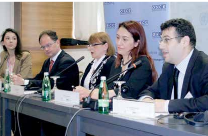
Дискуссия на субрегиональном семинаре по реализации Протокола РВПЗ в Юго-Восточной Европе, Сараево, май 2013 г.

примеры и интерактивные презентации по Орхусской конвенции и ее выполнению, роль и задачи Орхусских центров, участие общественности в природоохранной деятельности и соответствующая судебная практика. Авторами презентаций выступили преподаватели ВУЗов, представители судебной власти, сотрудники Министерства энергетики, развития и охраны окружающей среды, а также Бюро Комиссара по инфор-