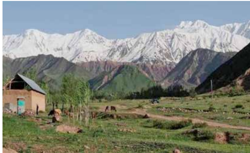
Раштская долина, Таджикистан

В Армении в мае 2012 г. начал свою работу Национальный центр по регулированию законодательства. Ему была оказана помощь со стороны многостороннего донорского консорциума, поддержанного Бюро ОБСЕ