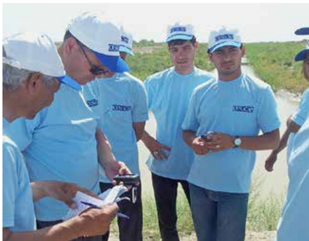
Местные специалисты водного хозяйства учатся использовать устройства GPS, г. Сердар, Балканский веляят, Туркменистан, мая 2013 г.

В 2012 г. Бюро ОБСЕ в Таджикистане также провело серию из четырех краткосрочных учебных семинаров по международному водному праву и принципам вододеления для должностных лиц из соответствующих министерств, агентств по управлению водными ресурсами, а также студентов из таджикских университетов. В семинарах приняли участие более 80 чел. По завершении каждого семинара были организованы поездки на трансграничные водные объекты и гидроэлектростанции. В 2013 г. Бюро ОБСЕ продолжает свои усилия по проведению тренингов для должностных лиц, работающих в водном и энергетическом секторах, как в Душанбе, так и в других районах страны. Кроме того, Бюро оказывает содействие Министерству мелиорации и водных ресурсов в проведении обучения для таджикских преподавателей по главным принципам интегрированного управления водными ресурсами и международному водному праву. Участники этого обучения для преподавателей впоследствии сами будут вести учебные курсы в Таджикистане, чтобы обеспечить устойчивость данных программ.