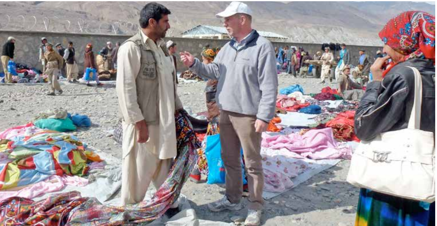
Сотрудник ОБСЕ беседует с афганским торговцем на приграничном рынке около с. Ишкашим Горно-Бадахшанской автономной области Таджикистана, 2012 г.

ОБСЕ работает в целях содействия трансграничной торговле и транспорту, чтобы создавать новые экономические возможности, в особенности, в отдаленных регионах.