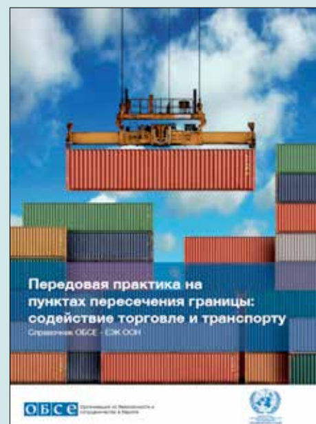
Лицевая сторона «Справочника ОБСЕ-ЕЭК ООН по передовой практике на пунктах пересечения границы - содействие торговле и транспорту» (русская версия)