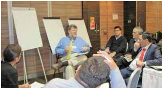
Участники Регионального совещания ENVSEC обсуждают приоритеты в сфере экологии и безопасности в Центральной Азии, г. Алматы, Казахстан, ноябрь 2012 г.

8 ноября 2012 в г. Алматы, Казахстан, партнеры по Инициативе ENVSEC провели региональное координационное совещание в Центральной Азии, чтобы обменяться последними новостями о текущей деятельности и согласовать будущие приоритеты в работе по снижению рисков для экологии и безопасности. К более чем 40 национальным координаторам Инициативы ENVSEC из Казахстана, Кыргызстана, Таджикистана и Узбекистана, прибывшим на совещание, присоединились представители стран-доноров, эксперты, другие ключевые заинтересованные стороны, а также представители БКЭЭД и полевых присутствий ОБСЕ в регионе. Участники совещания подчеркнули важность того, что партнеры по ENVSEC создают потенциал для интеграции результатов программ ENVSEC в политику и планы на национальном уровне. Было решено, что в рамках ENVSEC будут усилены мониторинг и измерение позитивных результатов для безопасности и долго-