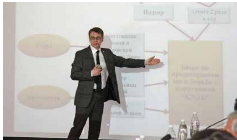
Выступление эксперта на антикоррупционном семинаре в Ашхабаде, апрель 2013 г.

В апреле 2013 г. Центр ОБСЕ в Ашхабаде , при поддержке БКЭЭД, организовал в Ашхабаде двухдневный семинар, посвященный теме «Механизмы укрепления добропорядочности в государственной службе, предотвращения коррупции и легализации коррупционных доходов». В нем приняли участие представители министерств финансов, внутренних дел, юстиции, национальной безопасности, а также Генеральной прокуратуры, Верховного и Арбитражного судов, Государственной пограничной службы, Таможенной службы и Государственной налоговой службы. Проведенное обучение было частью более крупного национального проекта, реализуемого Центром ОБСЕ в рамках содействия Туркменистану в подготовке к обзору выполнения его обязательств по Конвенции ООН против коррупции и к вступлению в члены Группы «Эгмонт» подразделений финансовой разведки. Эксперты из БКЭЭД, УНП ООН, Латвии, бывшей Югославской Республики Македонии и Сербии поделились примерами наилучшей практики в области предупреждения коррупции. Участники семинара обсудили, в частности, структуру антикоррупционных ведомств; стратегии антикоррупционных действий; меры по укреплению добропорядочности, включая кодексы поведения и имущественные декларации государственных должностных лиц; а также важность применения инструментов противодействия «отмыванию денег» для предотвращения коррупции и борьбы с