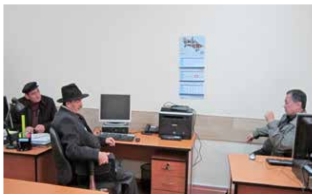
Обсуждение с гражданами таких вопросов, как экология озера Алтын-Асыр, в Орхусском центре в Ашхабаде, март 2013 г.

Центр ОБСЕ в Бишкеке продолжал оказывать поддержку Орхусскому центру в целях повышения информированности общественности об экологических проблемах и эффективного выполнения природоохранных международных конвенций и национального законодательства. Разнообразные обучающие семинары были проведены в потенциально подверженных конфликтам горнодобывающих районах Кыргызстана: г. Таласе, Чаткальском районе и Иссык-Кульской области. Повестка обучающих семинаров включала такие исключительно важные темы, как проведение оценки воздействия на экологию, доступ к правосудию и участие общественности в процессах мониторинга состояния окружающей среды.