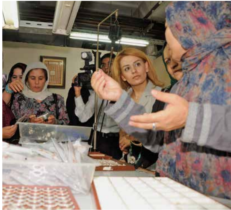
Женщины-предприниматели из Афганистана, Азербайджана и Таджикистана знакомятся с работой ювелирной фабрики во время обучающего семинара ОБСЕ, г. Стамбул, Турция, сентябрь 2012 г.

В сентябре 2012 г. в г. Стамбуле, Турция, при финансовой поддержке ряда делегаций в ОБСЕ и в сотрудничестве с отделением ПРООН в Афганистане, турецкой Организацией по развитию малого и среднего бизнеса (KOSGEB) и Международной ассоциацией справедливой торговли (WFTO), БКЭЭД организовало трехдневный обучающий семинар, за которым последовали двухдневные посещения успешных турецких предприятий по производству ювелирных и текстильных изде-