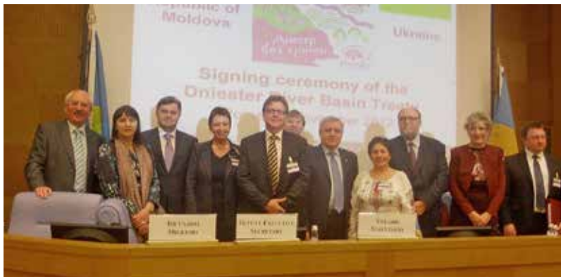
Церемония подписания договора о бассейне реки Днестр/Нистру, Рим, 29 ноября 2012 г.

17 декабря 2012 г, при поддержке Координатора проектов ОБСЕ в Украине и БКЭЭД , в верхнем течении реки Днестр/Нистру, около украинских населенных пунктов Галич и Залещики, были установлены и введены в эксплуатацию две автоматические станции мони-