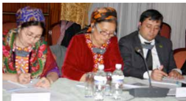
Местные эксперты получают информацию о международных методах оценки нефтегазовых комплексов во время семинара по энергетической дипломатии, организованного Центром ОБСЕ в Ашхабаде, март 2013 г.

26-27 марта 2013 г. в Ашхабаде БКЭЭД и Центр ОБСЕ в Ашхабаде организовали семинар по энергетической дипломатии . Мероприятие стало четвертым по счету в серии подобных обучающих семинаров с 2011 г. В нем приняли участие около 30 ведущих экспертов и должностных лиц из нефтегазового, энергетического, экономического и финансового секторов Туркмени-