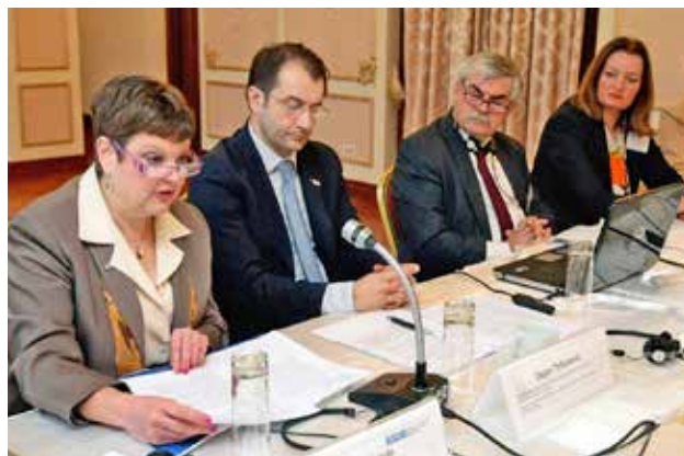
ОБСЕ поддержала проведение Регионального круглого стола по экологии и безопасности на Западных Балканах, Белград, ноябрь 2012 г.