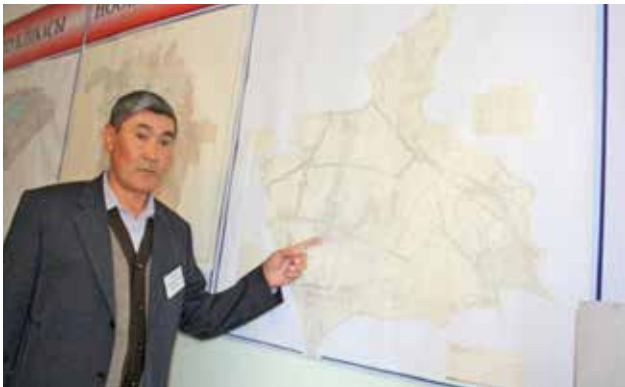
Центр ОБСЕ в Бишкеке поддерживает муниципалитеты в работе по улучшению управления земельными ресурсами, их инвентаризации и регистрации, Кыргызстан