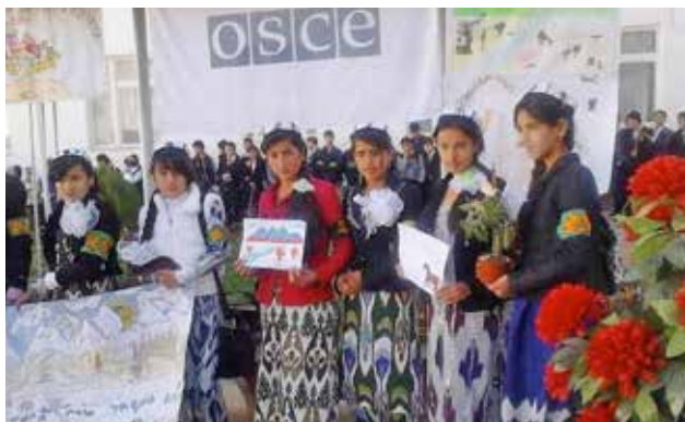
Школьники на празднике «Золотая осень», организованном в рамках проекта CASE «Зеленые патрули - надежные защитники природы», Таджикистан