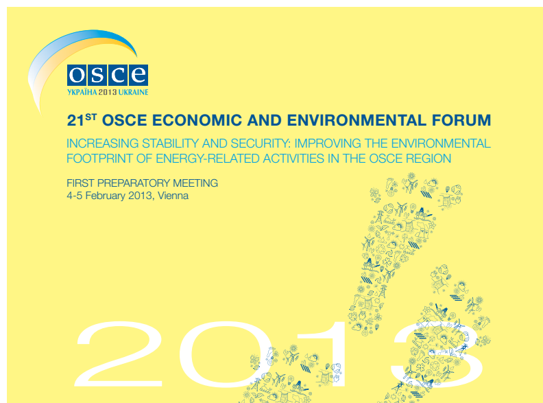
Логотип 21-го Экономико-экологического форума ОБСЕ

Первая подготовительная встреча Форума прошла 4-5 февраля 2013 г. в Вене. Ее участники проанализировали воздействие на окружающую среду различных источников энергии, как традиционных, так и новых. В частности, они обсудили, как можно уменьшить негативное воздействие на окружающую среду произ-