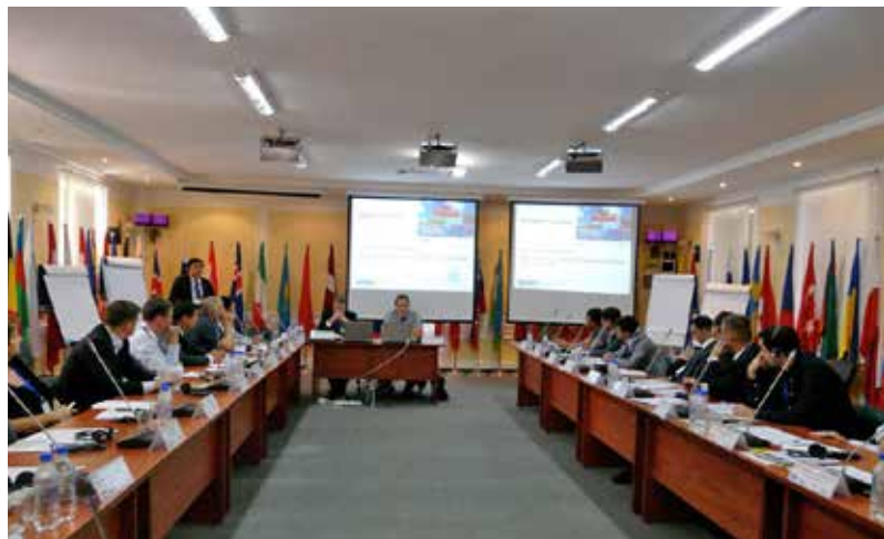
Пленарное заседание Регионального учебного семинара по программам УЭО, информационным технологиям и неконтактному досмотру, Душанбе, сентябрь 2012 г.

Центр ОБСЕ в Астане реализовал в течение отчетного периода восемь проектов , направленных на облегчение торговли, повышение эффективности транспорта и модернизацию таможенных процедур и практики. Большим подспорьем стал Справочник по передовой практике на пунктах пересечения границы. В частности, Центр ОБСЕ уделял внимание продвижению сотрудничества между таможенными службами и бизнесом в интересах содействия развитию международной торговли, снижения издержек от транспортных перевозок и импорта, повышения экспортного потенциала и конкурентоспособности, стимулирования экономического роста. В общей сложности, организованные Центром встречи и семинары собрали более 300 участников из парламента, правительства, бизнес-ассоциаций и местных компаний. Большинство мероприятий были посвящены недавно введенной в действие онлайн-овой системе декларирования товаров на пограничных пе-