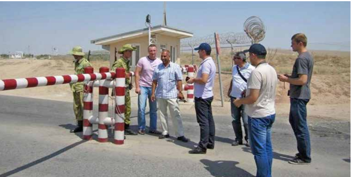
Ознакомительная поездка на таджикско-афганскую границу у с. Нижний Пяндж, июль 2012 г.

В июле 2012 г. в Душанбе БКЭЭД вместе с Пограничным колледжем ОБСЕ провели первый региональный учебный семинар по вопросам, освещаемым в Справочнике ОБСЕ-ЕЭК по передовой практике на пунктах пересечения границы . Эксперты из ЕЭК ООН, ВТамО, ЮНКТАД, а также из Австралии и Российской Федерации обсудили эти вопросы с более чем 40 слушателями семинара из Афганистана, Армении, Азербайджана, Беларуси, Грузии, Казахстана, Кыргызстана, Латвии, Молдовы, России, Таджикистана, Туркменистана, Украины и Швейцарии. В частности, они рассмотрели международные правовые рамки для торговли и таможенного контроля, а также конкретные методы укрепления сотрудничества между таможенными и другими пограничными службами. В повестке дня семинара также фигурировали подходы к управлению рисками, включая выборочность и профилирование, методы оценки работы пограничных служб. Одними из главных рекомендаций, высказанных на семинаре, были необходимость обеспечивать баланс между мерами безопасности и мерами облегчения торговли, развивать партнерские отношения с частным сектором. В последний день учебного семинара его участники посетили пункт пересечения таджикско-афганской границы у с. Нижний Пяндж.