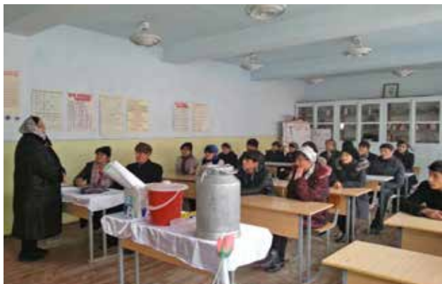
Мероприятие по повышению информированности населения в одной из школ Хатлонской области Таджикистана, посвященное применению энергосберегающих ламп и их безопасной переработке.

Бюро ОБСЕ в Баку продолжало оказывать поддержку правительству Азербайджана в улучшении его оперативной готовности к нефтяным разливам на море. Бюро ОБСЕ предоставило техническое содействие Министерству по чрезвычайным ситуациям Азербайджана в окончательной доработке проекта Национального плана реагирования на нефтяные разливы на море (Национального плана) для азербайджанском сектора Каспийского моря. Предполагалось, что этот план будет официально одобрен и принят Кабинетом Министров. Кроме того, Бюро организовало национальную правительственную конференцию по Национальному плану, которая предоставила ключевым заинтересованным сторонам возможность обсудить и определить их индивидуальные и совместные роли и обязанности по реализации данного плана.