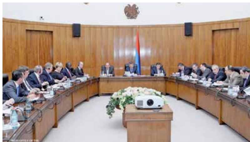
Совет по реформе обсуждает на своем заседании в Ереване упрощение регулирующих норм – процесс, поддерживаемый ОБСЕ

в Ереване. В консорциуме приняли участие Австрийское агентство развития, Правительство Ирландии, Всемирный банк, отделения Агентства США по международному развитию и ПРООН в Армении. Целью этого двухлетнего проекта быстрого упрощения механизмов регулирования являются рассмотрение и упорядочение регулирующих норм в 17 секторах экономики Армении. Политическим институтом, ответственным за надзор над проведением этой реформы, выступает Совет по реформе, возглавляемый Премьер-министром страны. К концу 2013 г. будут рассмотрены и упрощены законодательные акты, регулирующие 7 приоритетных секторов экономики, что сократит бюрократическую нагрузку на бизнес и граждан. Общий положительный эффект для экономики Армении оценивается на уровне 0,5% от ВВП страны. Бюро ОБСЕ в настоящее время занимается разработкой второго этапа реформы, в ходе которого, наряду с продолжением усилий по упрощению регулирования, начнут применяться инструменты оценки регулирующего воздействия.