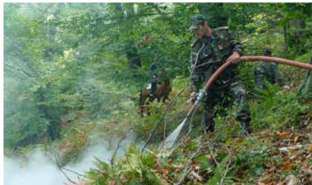
Полевые учения по противодействию лесным пожарам, проходившие в рамках проекта ОБСЕ-ENVSEC «Укрепление национального потенциала по борьбе с пожарами и снижение риска бедствий для дикой природы на Южном Кавказе», г. Габала, Азербайджан, сентябрь 2012 г.

В декабре 2012 г. 2-й Национальный круглый стол был организован в Армении с целью обсудить проект На-