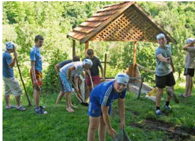
Информирование общественности и образовательные кампании среди школьников по экологическим вопросам являются ключевыми направлениями деятельности Координатора проектов ОБСЕ в Украине