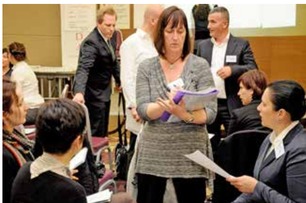
Региональный семинар для Юго-Восточной Европы по посредничеству в экологических вопросах и урегулированию конфликтов, Подгорица, апрель 2013 г.

3-5 апреля 2013 г. Миссия ОБСЕ в Сербии, в партнерстве с Министерством внутренних дел, организовала