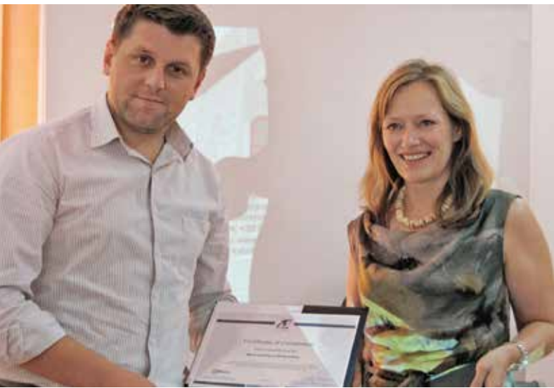
Представительница Миссии ОБСЕ в Боснии и Герцеговине (справа), вручает мэру г. Сребреница диплом об окончании курсов «СМИ и коммуникационный компонент», организованных в рамках Местной Первой инициативы, август 2012 г.

зрачности бюджета и улучшению управления бюджетами. Кроме этого, во всех десяти кантонах Федерации Боснии и Герцеговины Миссия помогала в укреплении практики надлежащего управления в политике и процессах принятия решений, в общении с гражданами и поддержании системы продвижения государственных служащих, основанной на их компетентности.