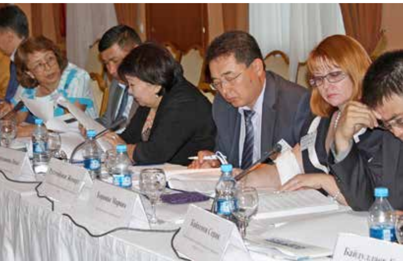
«Выполнение положений Орхусской конвенции сегодня: прокладывая путь к улучшению состояния окружающей среды и управления завтра», г. Алматы, Казахстан, май 2012 г.

вителей Министерства охраны окружающей среды, Центрально-азиатского Регионального экологического центра (CAREC), отделения ПРООН и Центра ОБСЕ. Они обменялись опытом и примерами передовой практики при обсуждении путей и средств, необходимых для того, чтобы гражданское общество могло более эффективно решать экологические проблемы на национальном и местном уровнях, а также способствовать развитию низкоуглеродистой экономики, использованию возобновляемых источников энергии и эффективному управлению водными ресурсами. Участники конференции также рассмотрели работу, связанную с Орхусской конвенцией, Протоколом о регистрах выброса и переноса загрязнителей, Инициативой о прозрачности добывающих отраслей (EITI) и созданием активной сети национальных Орхусских центров. Центр ОБСЕ внес свой вклад в обсуждение вопросов повестки дня, предоставив обзор деятельности ОБСЕ в экономическом и экологическом измерении, которая включает участие общественности. Кроме того, в Казахстане были специально разработаны пять проектов для поддержки вновь созданных Орхусских центров. Они заложили основу для создания национальной общественной сети Орхусских центров и экологических НПО.