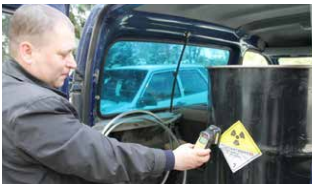
Молдавский эксперт осуществляет контроль радиоактивных источников, упакованных для транспортировки

Бюро ОБСЕ в Ереване в сотрудничестве с Министерством по чрезвычайным ситуациям проводит «Исследование по оценке площади и осуществимости реабилитации могильника стойких органических загрязнителей и просроченных пестицидов в Нубарашенском районе Армении». Соответствующий Меморандум о взаимо-