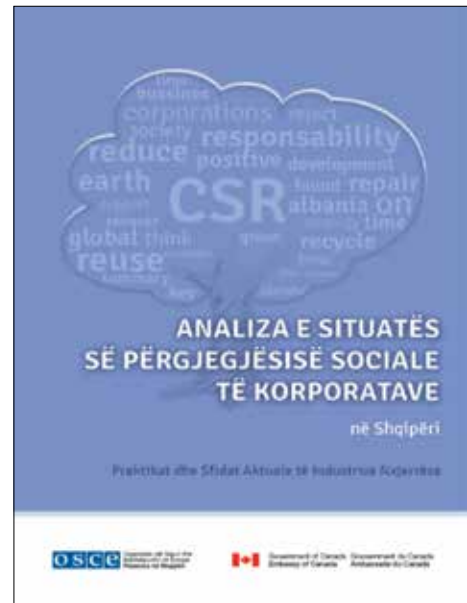
Доклад с ситуационным анализом социальной ответственности корпораций в Албании: современная практика и проблемы добывающих отраслей; версии на английском и албанском языках.