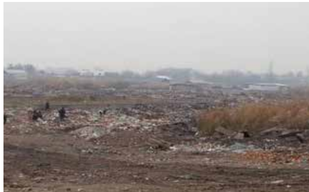
Небезопасная утилизация отходов вблизи населенного пункта в Хатлонской области, Таджикистан

понимании был подписан в ноябре 2011 г. Финансирование проекта осуществляется Правительством США. Предполагаемый объем работ, состоящей из трех этапов, включает: оценку площади места захоронения; содействие оценке рисков; и содействие выработке технических решений на долгосрочную перспективу. Также будет выполнена оценка рисков для здоровья, с использованием местного опыта. До настоящего времени были осуществлены полевые исследования и анализ заинтересованных сторон на основе «быстрого сканирования». Планируется, что реализация проекта будет завершена к концу августа - началу сентября 2013 г. В 3-м квартале 2013 г. состоится итоговая Конференция доноров, чтобы представить выводы обоих исследований.