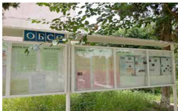
Стенд с информацией об экологических проблемах в регионе, Орхусский центр в г. Курган-Тюбе, Таджикистан

19-20 апреля 2013 г. Миссия ОБСЕ в Сербии , в сотрудничестве с Белградским факультетом права и Орхусским центром в г. Крагуевац, провели семинар на тему обеспечения соблюдения экологического законодательства в Сербии . В нем приняли участие около 50 студентов-юристов из университетов Белграда, городов Нови-Сад, Крагуевац и Ниш и представители экологических НПО. Целью семинара было расширить знания студентов-юристов о национальном и международном природоохранном законодательстве; вооружить будущих юристов, судей и прокуроров Сербии правовыми инструментами, необходимыми для реализации природоохранного законодательства страны. Темы модулей семинара включали практические