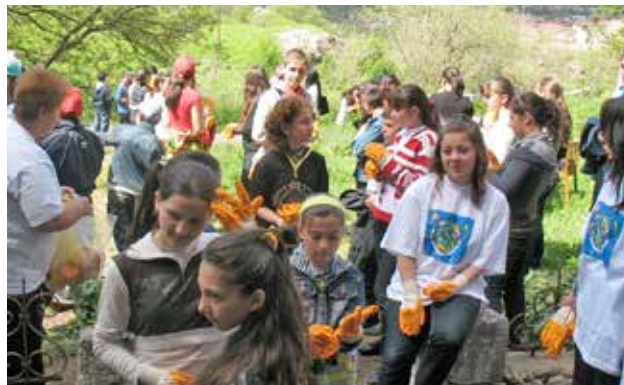
Школьники на мероприятии по повышению информированности об экологических проблемах, организованном в рамках Программы CASE, Армения

Программа CASE охватывает в настоящее время три страны, а именно: Азербайджан, Армению и Таджикистан, и она к настоящему времени поддержала реализацию 57 проектов. С мая 2012 г. по май 2013 г. Программа CASE оказала поддержку следующему числу проектов НПО: 6 в Армении, 6 в Азербайджане и 8 в Таджикистане.