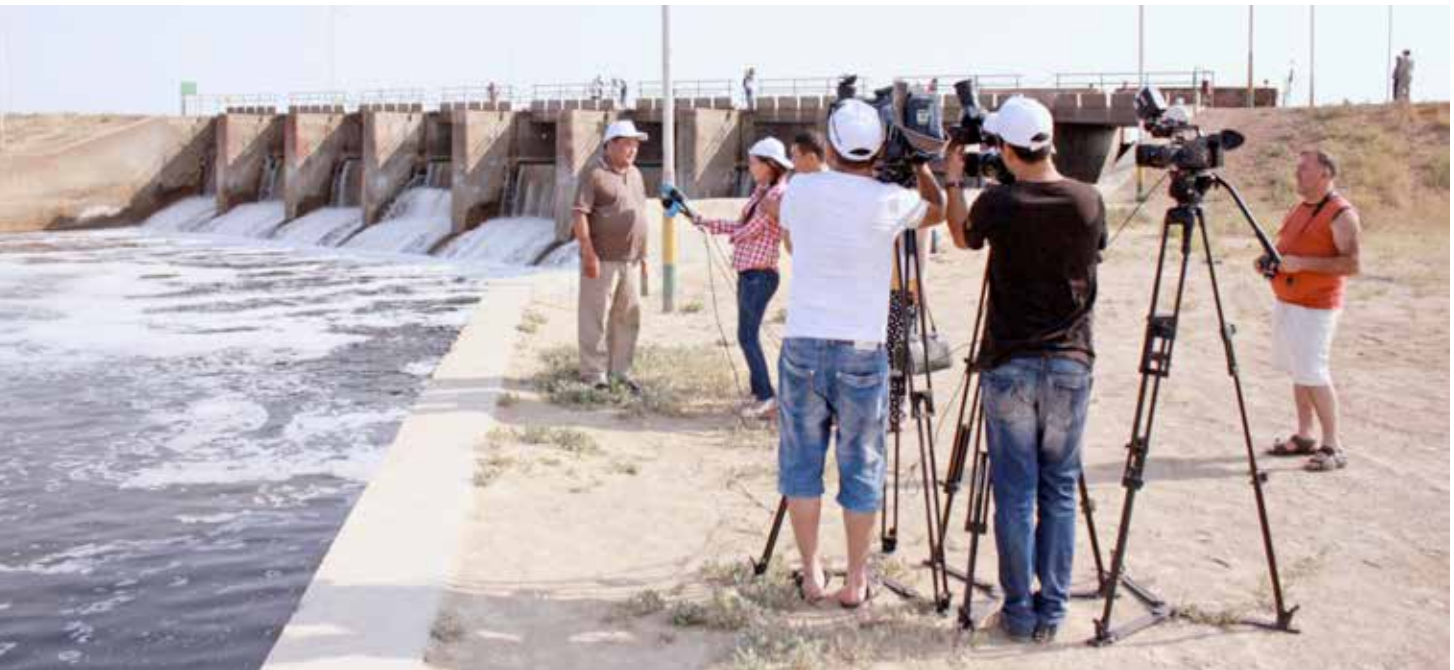
Центр ОБСЕ в Астане поддерживает деятельность по управлению водными ресурсами в Кызылординской области Казахстана

Региональной Целевой группы по трансграничному сотрудничеству на малых реках в Центральной Азии. Этот проект будет способствовать усилиям комиссии Казахстана и Кыргызстана по управлению водными ресурсами бассейна рек Чу-Талас, которая пользовалась поддержкой ОБСЕ со времени ее создания.