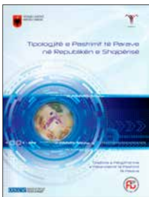
Справочник по типологиям отмывания денег в Республике Албании

17 апреля 2013 г. Присутствие ОБСЕ в Албании и Департамент противодействия транснациональным угрозам/Отдел стратегических вопросов по-