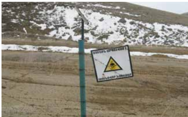
Забор и предупреждающий знак о стойких органических загрязнителях и устаревших пестицидах перед могильником в Нубарашенском районе Армении

проект по проблематике изменения климата в Восточной Европе, на Южном Кавказе и в Центральной Азии. Проект будет осуществляться партнерами Инициативы ENVSEC, сформировавшими консорциум, под общим руководством и при координирующей роли ОБСЕ, на основе консультаций с ЕС и его представителями.