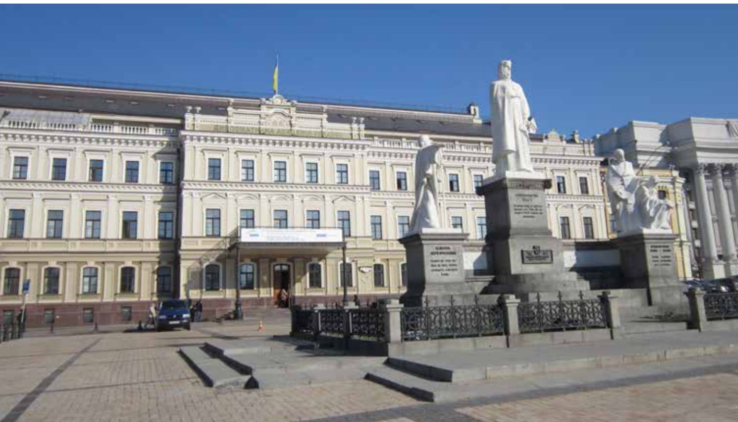
Дипломатическая академия в Киеве – место проведения Второй подготовительной встречи Форума в апреле 2013 г.

развитию энергетики; инновации и передача технологий в области устойчивого развития энергетики; а также укрепление безопасности и стабильности на основе партнерских связей в области устойчивой энергетики.